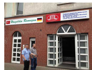
Merkez Moschee in Gelsenkirchen