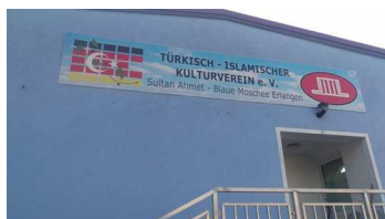
Sultan Ahmet - Blaue Moschee in Erlangen

Bisher wurden 15 Kooperationen mit Moscheen in Essen, Gelsenkirchen, Duisburg, Dortmund, Düsseldorf, Hamm, Hamburg, Salzgitter-Lebenstedt, Mainz, Offenbach, Erlangen, Nürnberg sowie Berlin geschlossen. In vielen Moscheen konnten die Kurse bereits gestartet werden, bzw. steht der Start der Kurse kurz bevor. Einen detaillierten Überblick über die Moscheen gibt Ihnen eine Deutschlandkarte auf unserer Webseite.